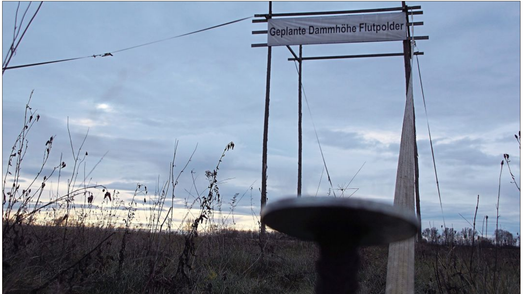
Das Raumordnungsverfahren zum geplanten Flutpolder hat begonnen. Oder? Der Antrag ist nämlich nicht unterschrieben.