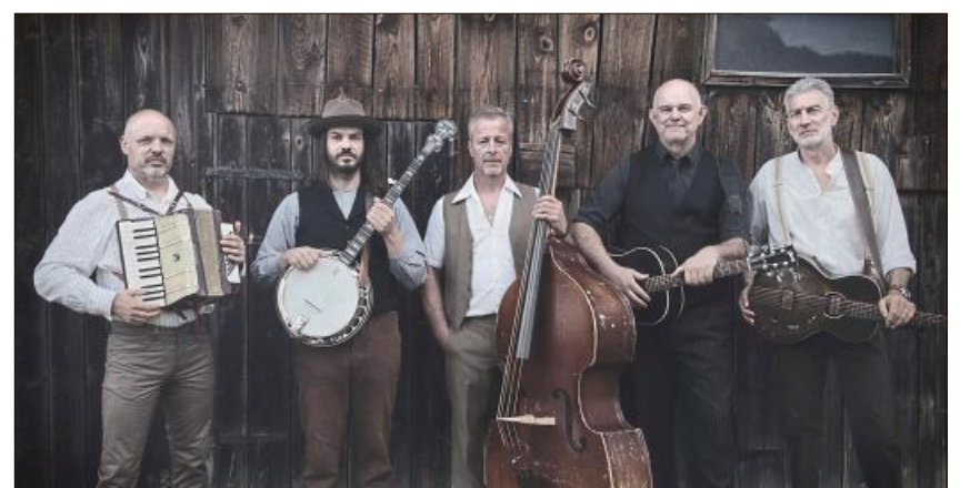
The Rooster Crows gastieren am Samstag, 11. Februar, im Wiesenter Sommerkeller.

Durch eine Vielfalt an akustischen Instrumenten, mehrstimmigem Gesang und dem respektvollen Umgang mit den Originalen drücken The Rooster Crows den Liedern ihren eigenen Stempel auf. Die Eintrittskarten kosten im Vorverkauf 15 Euro und an der Abendkasse 17 Euro. Sie sind im Rathaus Wiesent, bei der Bäckerei Fuidl und bei der Bäckerei Weber erhältlich.